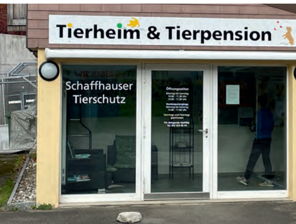
Neue Beschriftung beim Tierheim Buchbrunnen

Welche Unterbringung ist die beste für unsere Tiere und Pensionsgäste? Welcher Hund, welche Katze verträgt sich mit wem? Kann die Zuteilung zu den Räumen einzeln oder zu mehreren sein? Je