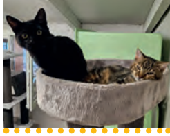
Levi & Faye Männchen und Weibchen ca. 1.4.2023