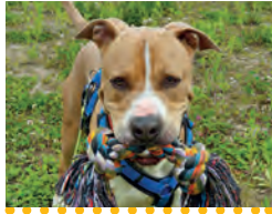
Blue American Staffordshire Terrier Männchen 1.7.2017