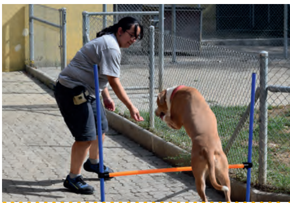
Beschäftigung der Tierheimtiere