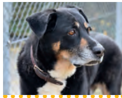
Madox Mischling Männchen 8.10.2010