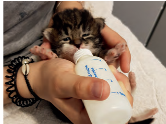
Aufziehen eines verwaisten Katzenbabys

Wir haben eine integrierte Igelangfangstation vor Ort, in der wir verletzte, untergewichtige und verwaiste Igel pflegen, aufpäppeln, tierärztlich behan-