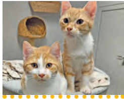
Kaito & Kirito Männchen ca. 1.4. + 21.4.2023

Möchten Sie einem der folgenden Tiere ein neues Zuhause geben? Dann melden Sie sich bei Interesse im Tierheim Buchbrunnen: 052 643 59 11