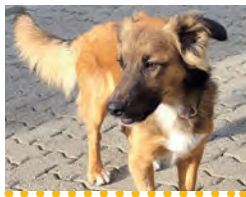
Merlin Mischling Männchen, kastriert 20.9.2021